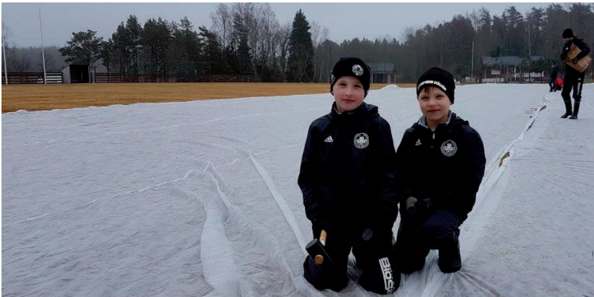
Fiberdukstalka på våren