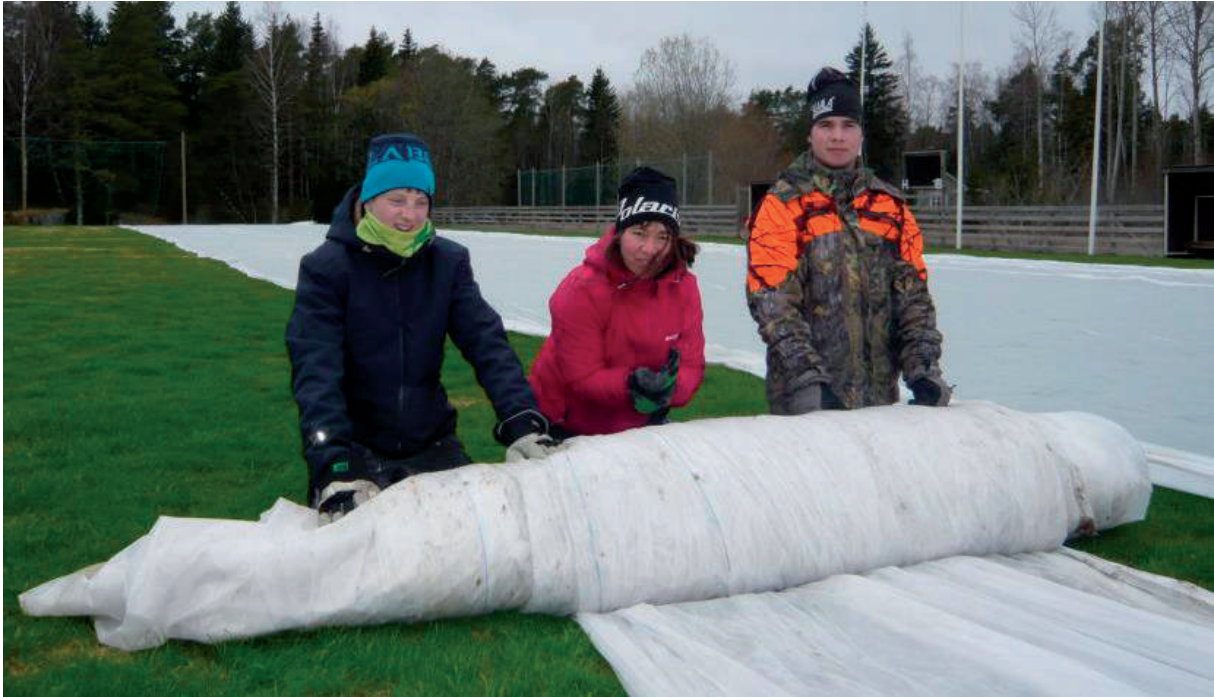
Fiberdukstalka på våren